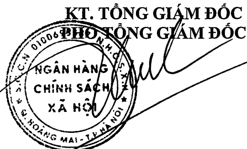
Huỳnh Văn Thuận

Ý kiến của đ/c lamdq_cn35 gửi lúc 17:00 - 09/07/2021